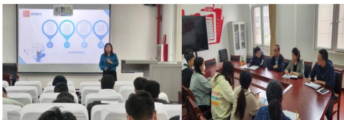
简历与面试专题讲座 学生工作部开展就业工作调研