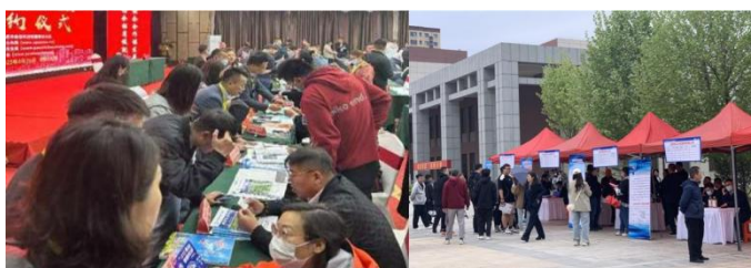
访企拓岗就业洽谈会现场 “才聚金牛 筑梦青春”引才宣介会