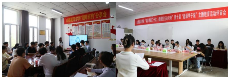
朋辈有约第二期现场

教育，引导学生厚植爱国情怀，增强大学生的民族自信心和自豪感。 四是 组织开展品牌思政教育活动第十届能源学子说主题教育活动，通过组织相关系部教师代表担任评审，对本届能源学子说主题征文、板报设计、短视频等作品进行了评审，在学生群体中深入学习宣传贯彻党的二十大精神，引导广大能源学子坚定理想信念、筑牢信仰之基。